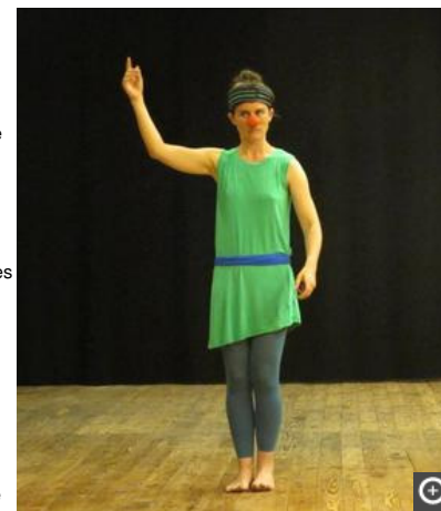
Les clowns posent leurs valises sur les planches de La Charpente, jusqu'à demain.